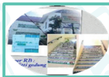
Geger RB (Graffiti dan Galeri RB DI GEDUNG BBPOM MAKASSAR

Kegiatan sosialisasi Budaya PIKKIR dan RB dengan menghias bangunan gedung, seperti Pemasangan poster/infografis tentang PIKKIR, RB dan kata-kata motivasi/bijak pada sisi-sisi dinding Gedung