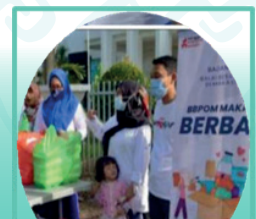
BPOM BERBAGI (Aksi Sosial 2 Kali Sebulan)

Kegiatan berbagi kepada masyarakat dan/atau kelompok yang membutuhkan, dilakukan setiap 2 kali dalam sebulan pada hari Jumat